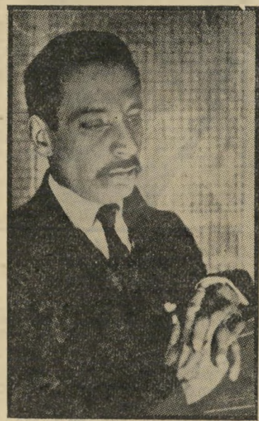
ריינר מריה רילקה חתוי פניו שהיו סדורים יישארו לעד

ריינר מריה רילקה, משורר גרמני מראבות המודרניות בשירה הגרמנית, נולד בפראג (1875). במשך קרוב לשנתיים שיר בש רילקה כמזכירו של הפסל אוגוסט רודין. ספריו הנודעים בשירה הם שירים