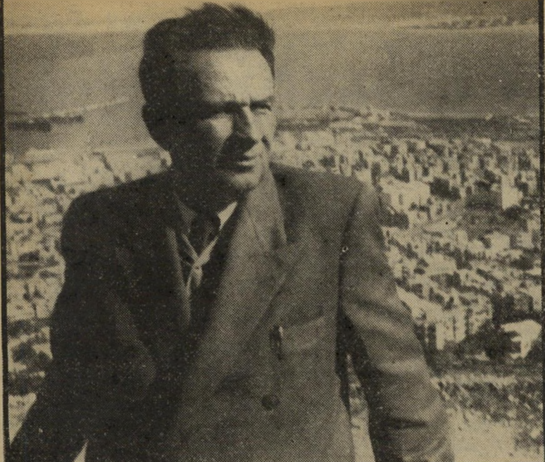
ראש-עיר לשעבר חושי כולם ללכת ליטון

(המשך מעמוד 77) מסגרת קבוצה, שעושים לו טובה כש- מערתים אותו. לעומת דן-כרמל נראים מאמצי עובדי שני מלונות אחרים, בני ארבעה כוכבים, כראויים לציון. במלון נוף, שכנו של דן-כרמל ובמלון שולמית, השייכים שניהם לאותה הרשת, החדרים קטנים יותר, השטיחים הציבוריים (חדרי אוכל, לובי, באר) קטנים יותר, אך המאמץ להנעים את שהותו של האורח גדול יותר. מלון אחר בן ארבעה כוכבים, ציון, הנמצא בהדר, הוא שעוריה תיירותית שקשה למצוא דוגמתה אפילו בארץ. המלון שהיה עד