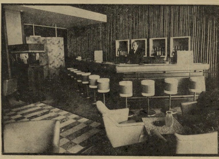
הבאר שהי "דן כרמל" אף אחד לא בא