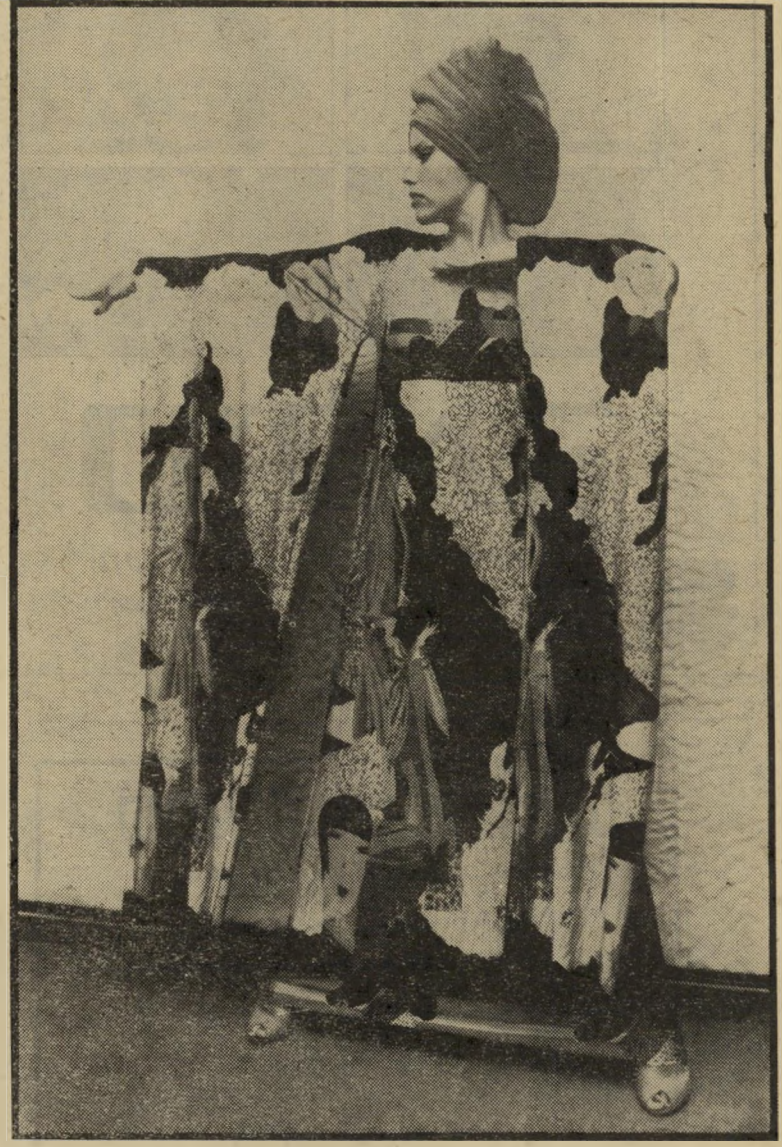
בגדי-מארחת הוולר איך עושים אותו בשנט אחד

על קו האמצע החוצה את הבגד עד למ"ט, ומציירים בגיר רבע מעגל מכל צד כך שיפגוש את הנקודות סימון גוזרים רק קדימה את החצי עיגול הזה שנוצר והופה, יש פתח צוואר. (ה) נקודת האמצע העליונה, שעדיין לא מחקנו, למרות שגזרנו פתח צוואר, מודדים 20 ס"מ מצד ימין, ו-20 מצד שמאל, עושים כנ"ל לגבי נקודת האמצע של המכפלה. 20 מצד ימין, ו-20 מצד שמאל. בעזרת סרגל ארוך או סרט סני"טימטר, מחברים בגיר, בקו דק, את ה-20 ס"מ העליונים, הימניים, עם ה-20 ס"מ הימניים התחתונים, וכנ"ל בצד שני. זה יהיה קו הסימון של "שופרת" השימלה, ויאפשר בקרה מאוחר יותר, בכמה נרצה, אם נרצה, להצר את ההתרחבות של הטרי"פון. (ו) כעת, בשפה החיצונית-היצונית של העסק, מלמעלה לכיוון מטה, בצד ימין, מודדים 22 ס"מ, ומסמנים. עושים אותו דבר בצד השני. מחברים נקודת סימול ימנית, עם נקודת סימול שמאלית. על הנקודות שקו זה פוגש מימין ומשמאל, אלה נקודות סימול "שופרת" הבגד, שי"סימנו בשלב קודם, עושים איקסים. זהו, בזה הרגע יצרתם בדיוק את נקודות בית"השחי. (ז) יורדים למטה, לקו המכפלה התח"תונה, ומתחילים לספור מהשוליים החיצו"ניים הימניים ככה: 30 ס"מ, ומסמנים. מנקודה זו, מודדים עוד 80 ס"מ, ושוב מסמנים. מנקודה זו, אם הבד ברוחב מטר ו-40 ס"מ, נותרים עוד 30 ס"מ. מה יצרנו? יפה מאוד! שתי נקודות על קו המכפלה.