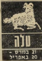
21 במרס - 20 באפריל

זמן, מרץ ומחשבה תקדישו בשבוע זה לעבודתכם. קפדנות, דיוק, זריזות ומומי- חיות יאזרו אתכם מ' שאר העובדים. יתכן שתגיעו לשלב שבו תהססו אם כדאי ל' המשיך באותה עבודה, מכיוון שרמזים שיגיעו לאזינכם על אפשרות קידום במקום אחר, לא יתנו לכם מנוח. יש להזהר מכל מילה היוצאת מפיכם בתקו- מה זו, אתם עלולים לספר בשגגה דב- רים שראוי להם שיאסרו בגדר סוד.