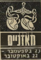
21 בספטמבר - 22 באוקטובר

אתם מחפשים קשר רומנטי חדש, ומת- אכזבים מההצעות שהוצעו עד עכשיו. קשה לבטא רגשות ב- ימים אלה, עדיף לה- כות זמן מה, התקופה לא מתאימה להתח- לות חדשות. רגונות, אימפולסיביות ומת- משתקפים ביחסי עבו- דה עם אנשים בעלי מזג קשה וביולתי-מת- פשר. אתם נאלצים ל- המצא בסביבה רועשת, ומתגעגעים לשקט ולשלווה שאליהם אתם רגילים. בן מזל דגים עשוי להנעים את הזמן, ולסייע לכם למצוא מרוגע.