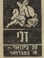
20 בינואר - 18 בפברואר

אירועים משתרחשים בחייהם של אחרים ישפיעו גם עליכם. יש לנהוג בזהירות בכל מה שקשור לעניי- ני כספים, במיוחד אם קרובי-מישפחה קשו- רים בדבר. לא כדאי לסמוך על האינטואי- ציה שלכם בשבוע זה, עדיף להקשיב למומי- חים, ולקבל את עז- תם. המנעו מקניות נחפזות ומביזבז כס- נים, יש לדאוג לחס- כונות, ולשלם בזמן מיסים או ביטוח. הרצון לשנות מקום-מגורים מעסיק את המחשבה. כדאי לזחות זאת לזמן קצר.