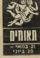
21 במאי - 20 ביוני