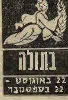
22 באוגוסט - 22 בספטמבר