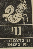
21 בדצמבר - 19 בינואר

בתקופה זו ידובר על נסיעות לחוץ-לארץ, אורחים משם עשויים להגיע, ולהוציא אתכם מהשיגרה בה שקעתם. הוצרך בשרי נני מורגש גם במקום עבודתכם, לא כדאי ל' התעקש להמשיך דווקא במקום שממנו לא שבעתם נחת. לשמועות שיגיעו לאזינכם על אפשרות להתחלה חד- שה יש להתייחס ברצי- נות, ולשקול השתלמות או לימודי-המשך בשפה המעניין ומושך אתכם זמן רב. אל תסרבו להזמנה למסיבות.