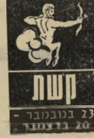
23 בנובמבר - 20 בדצמבר