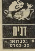
19 בפברואר - 20 במרס

בתקופה זו טוב שתף פעולה עם שות- פים לעבודה, ולהתחשב בתוכניות שהם מציעים. יש להזהר מ' אנשים המדברים ישר לעניין, ומסתירים את מניעיהם האמיתיים. ידידים ישנים חושבים על קשר מסוג אחר, ו' מתחילים להדמנות לשו- חז שיחה גלוייה. הי- ענות להם עשויה להי- מיאת לתקופה חדשה. רני מנטיט ומלהיבה. והיו יותר יותר פופולריים בתקופה זו, ויותר אנשים יחפשו את קרבתכם ותשומת לבכם.