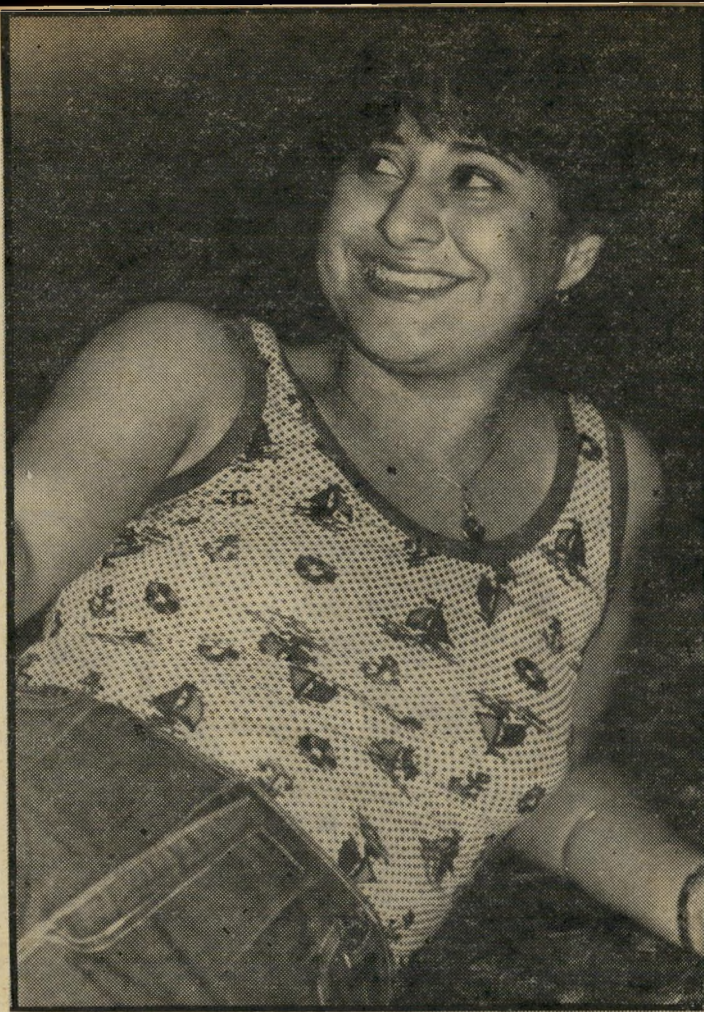
כותב וג נפש הרפתקנית

שכן השוטר בבית-המישפט מנע את העברתו לידי הנאשם. אך הפירסום שבו זכה הבהיל את ריבך קה. „לא תיארתי לעצמי שאנשים יגיבו כך על מיכתב כל כך פשוט. מהרגע שזה פורסם סעיתון, הטל-פון אצלי בבית לא מפסיק לצלצל. כל מיני אנשים שאני בכלל לא מכירה מתקשרים אלי. יש כאלה