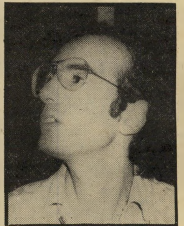
במאי סרג' אנקרי לויטל - כן, לקאהיר - לא