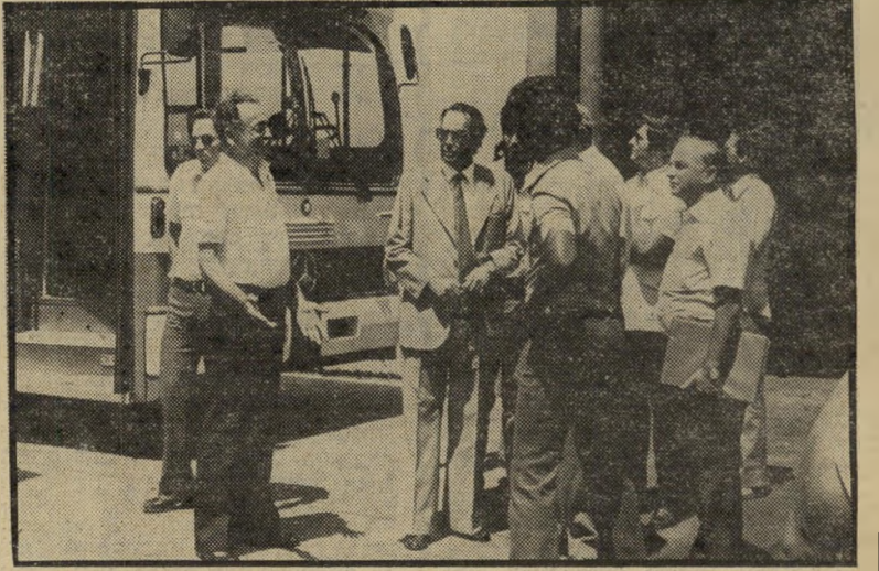
שגריר מצריים (במרכז, במישקפיי-שמשי) עם הנהלת "אגד" מה למדוד?