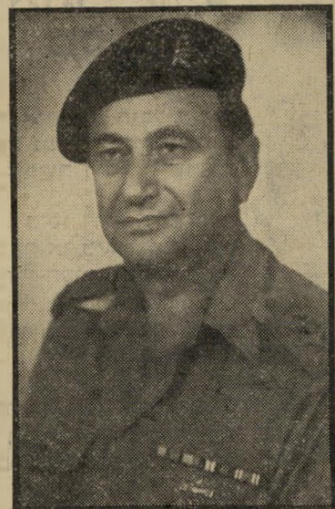
ראש-אכ"א נתיב יורדים אחרי שנה

מתצי שנה, מעבירים אותו חזרה ליחידת מילואים סדירה, בין אם זו היחידה שבה הוא משרת או יחידה אחרת.