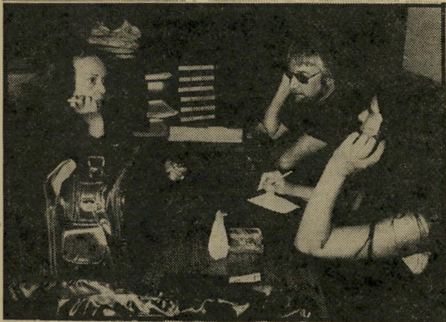
אדווה, מרסר ומורו יד נשית וגורל אכזר

בתצלום שפירסמתם, רואים מצד אחד את השחקנית הצרפתייה ז'אן מורו, שערכה ביקור חטוף בישראל, ומצד שני את התסריטאי ה"מגוח דויד מרסר, כמה ימים לפני