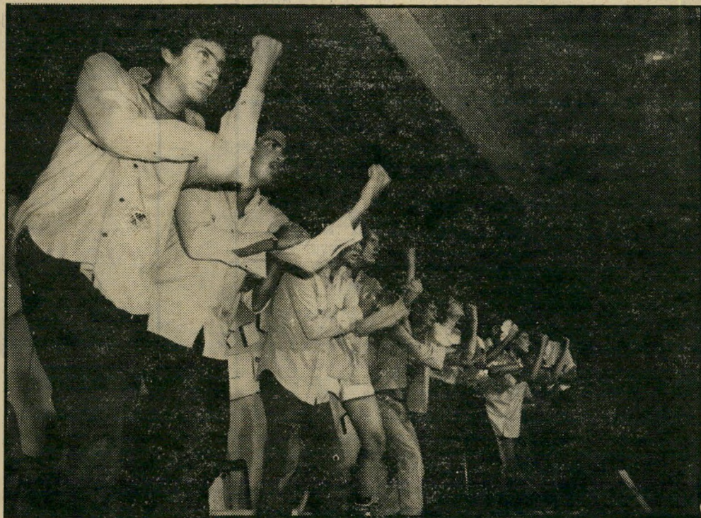
תלמידי "ליידי דיוויס" "נא" לכל העולם

פתחה. נרמו למנהל בית-הספר שאם הוא מעוניין להמשיך בתפ- קידו, עדיף שישיטיק את הפרשה ויוריד את ההצגה. המחזאי שוקי וג- רר מסוכן. שכתב וביים את ההצגה. משר מש מנהל התגלדרמה בליידי דיוויס מזה כמה שנים. "עבדתי על ההצגה כמשך שנה שלמה," סיפר. "היא נועדה להביע את מה שמתרחש בליבו של הנוער כיום. זהו מחזה אקסולאי, שמבוסס על