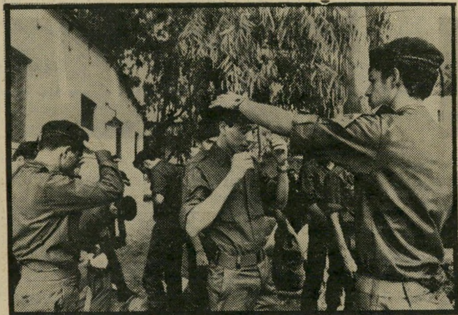
המ"כ בפעודה לחמוד הכל מההתחלה

אחרי שמפתיים הגיוס, רי איציק וחבריו כבר לובשים את מדי הטירון, ללא כל סמלים, או תגים, ואפילו ללא תג-כובע, הם מובלים, שוב בשלוש, לחדר האוכל הענק של בקר"ם. סיפר הר שבוע משה, מי שהשתחרר מי בקר"ם לפני ימים ספורים: „אחת החוויות הנוראות בבקר"ם היא חדר-האוכל. האוכל הוא מתחת לכל ביקורת, ככה זה נראה לנו, האוכלים. אבל יתכן שזה לא אש-מת הטבחים אלא אשמת המקום והאווירה. מאית חיילים הממהרים