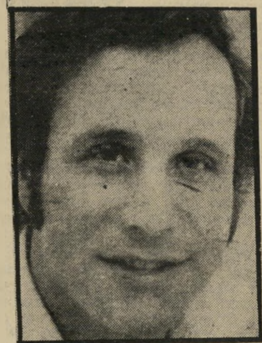
נספח קושניר לוביאנג באגף הימני

צירו בנספח שייכנס למירוץ, והם גם עושים את הלוביאינגי עבורו.