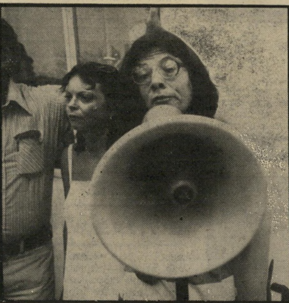
עורכת חן להתמודד עם יחושך