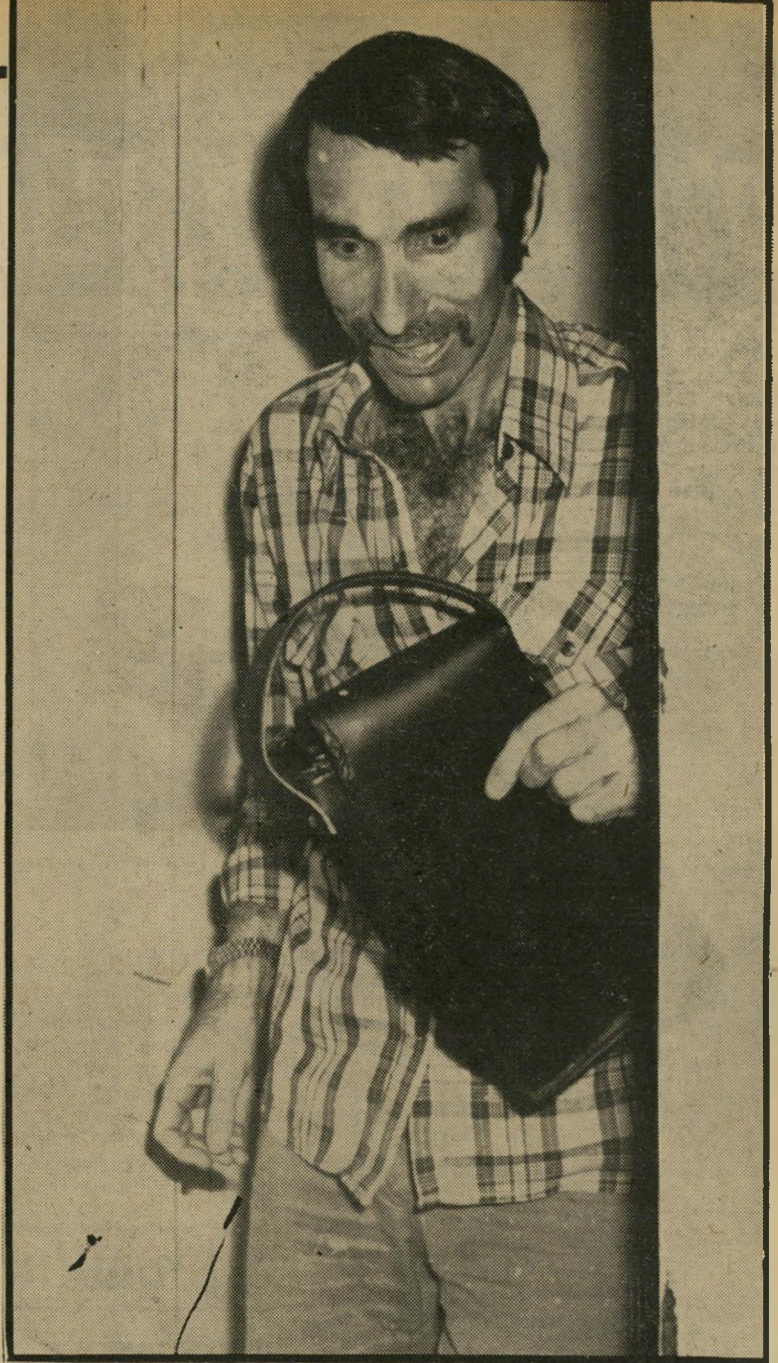
מנפיק-מצלמה טנר רגע של זעם

כל העניין הזה לגמרי לא מתאים לאופי שלי. אני לא מסוגל להסביר את זה. זה פשוט קרה, וזהו. אני גם לא יודע אם רציתי לשובור באמת את המצלמה