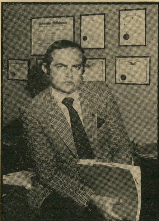
היורדים המציאו את „המאכיה“

לראות את כל עשרות אלפי הישראליים, שבאים אלי, ושאני יודע שהם אבודים למדינת-ישראל. הבעייה היא שהחלום האמריקאי עוד נפוץ. יש לי מיסרד בישראל, ובשהותי האחרונה בארץ ראיתי יותר מ-150 איש ליום. בכלל, כשאני מגיע לארץ אני הופך לאיש הכי פופולרי. כל אחד שואל אותי איך הוא יכול להגיע לאמריקה. אני אמנם עושה מזה כסף, אבל זה כואב מאוד. אני מעדיף לעשות את הכסף הזה על המהגרים הערביים, הצרפתיים והאיטליים, ולא על הישראליים.