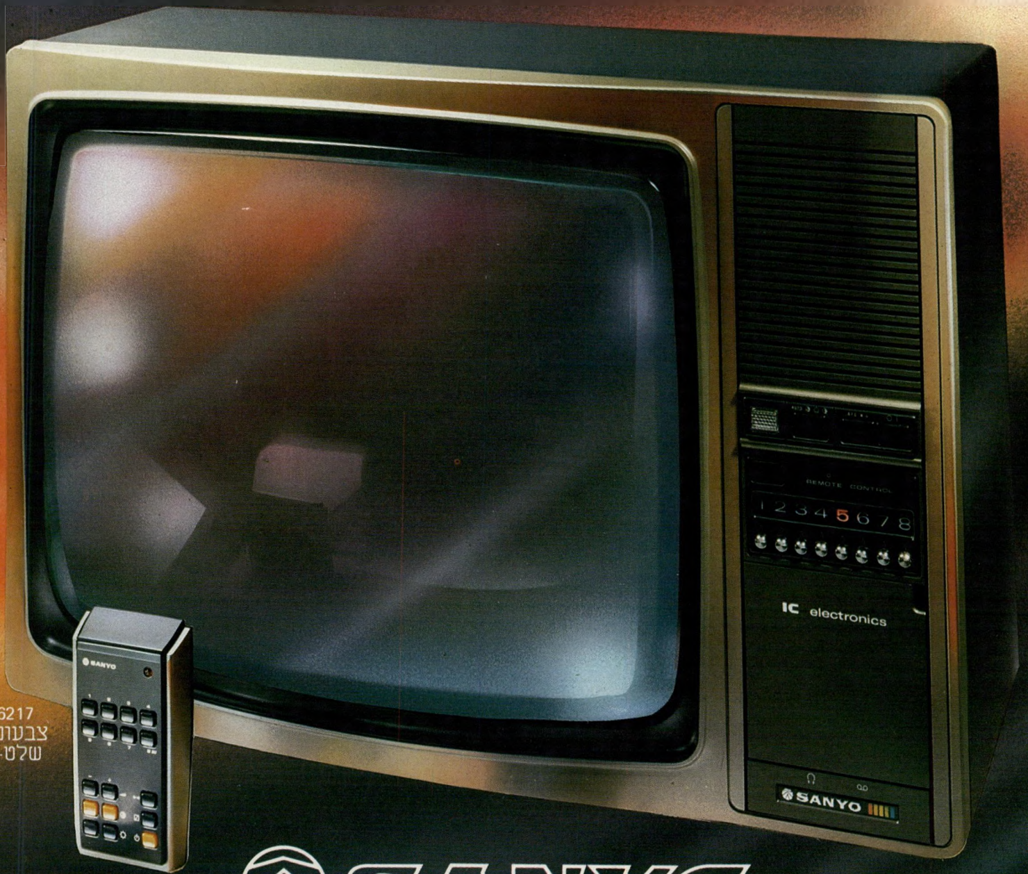
CTP 6217 צבעונית 20" שלט-רחוק