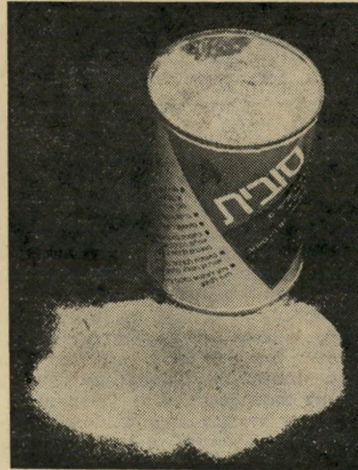
סובית פגו שומן סכרת

אחרי שרופאים מכובדים בארץ ערכו ניסיונות וגילו במעקב, שכף אחת סובית ליום עוזרת להוריד את רמת-הסוכר בדם