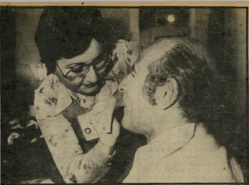
עיתונאי בן-פורת ומאפרת להתכונן לערוץ השני

חופשית בבחירת המרואיינים ובקביעת סדר הופעתם.