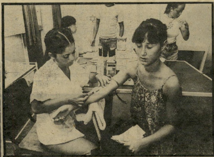
דם של בת-17 מגלות את המחלות —