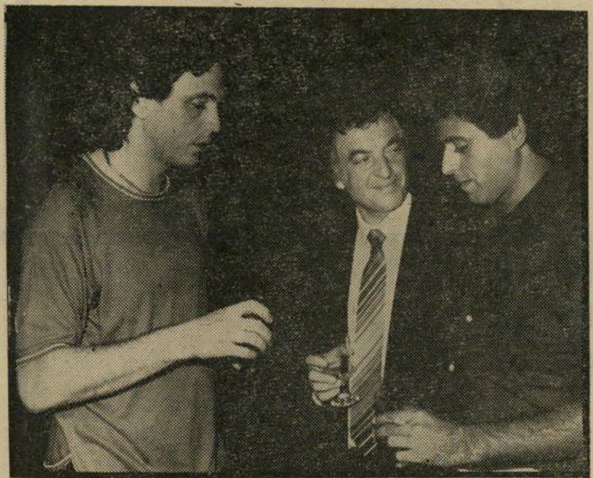
זמרים תבורי ופיק עם פלטרשרון קרובי-מישפחה במקום אישים

היה מגולה למישעי, בעוד ששמי חי שהגיע לתחנת-המישטרה היה בעל זקן. במשך עשר הדקות ש"עברו בינתיים לא יכול היה האיש לגדל באופן טבעי זקן נאה כל כך. פורקים או גונבים, כאשר שאלו את שמחי לפרש הדבר אמר בתמימות: "אתם לא ראייתם טוב, הרי ליד המיכנה לא היה אור."