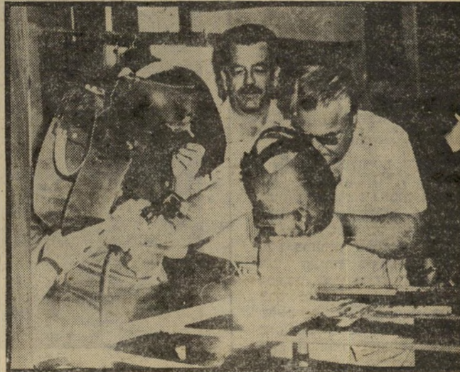
פועל ז'אק אמיר סיים את בית-הספר התיכון המיק-צועני "אורט" בקאזבלאנקה. עד היום הוא בוגר בית ספר "אורט" היחידי שהגיע לכנסת. בארץ החל לעבוד כמסגר.

פיקחות המהולה בניסיון חיים עשיר. נוסף על היותו חבר-כנסת מש מש אמיר גם ראש-עיריית דימונה. מבחינה זו הוא יצר תקדים. כל ראשי-הערים שהיו עד כה גם חברי-כנסת, נבחרו לבית-המחוקקים לאחר שכבר שימשו בתפקידים המוניציפאליים. ז'אק אמיר נבחר קודם לחבר-כנסת ורק אח- פירסומים בעיתונים כאילו אנו עומדים משני עברי המיתרס. אר לם אמיר לא התחייב, כי בעתיד לא יתמודד נגד משל. בקרבת הפועלים נהנה אמיר מת-מיכה רבה. תפקידיו הקודמים כ- יושב-ראש מועצת-עובדי-מיפעלי-ים-המלח, יושב-ראש ועד-עובדי-התעשייה-הארצי, וחבר הוועד-הפועל של ההסתדרות, העניקו לו