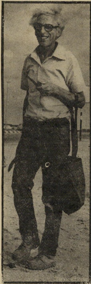
רקף הלינגר לכל עיר דגל משלה

שמעתי שמטילים עוצר בגלל הנת פת דגלי פלסטין. זה נראה מגוחך, כיוון שעלידי כך לא נגרם נזק כלשהו. הרי הבטחנו אוטונומיה, הכוללת, בדרך כלל, גם את הזכות לדגל, כפי שלכל עיר יש דגל משלה.