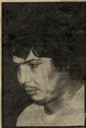
סעדיה מרציאנו בחירה מוטעית

יוצאי עדות-המיזרח, לרבות תושבי שכונות-המצוקה, אינם רר-אים בסעדיה מרציאנו או בצ'ארלי ביטון, אנשים חסרי-השכלה העומ-דים מבחינות רבות על סף הר-עבריינות, נושאים להזדהות. הי-פוכו של דבר: עצם המחשבה שניתן בעזרת דמויות כאלה למשוך את קולנו היא בבחינת עלבון, משום שניתן להבין מכך שכולנו דומים להם או שאופים להידמות להם. דמויות חינוכיות, דוגמת