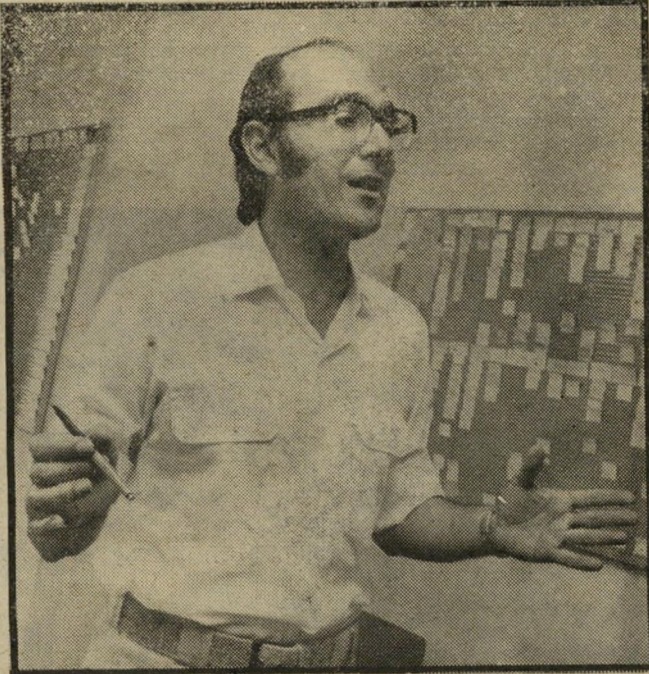
שופט קרמי סניגור על חשבון המדינה

אנשי-הביטחון בנמל-התעופה בן-גוריון העיפו מבט לעבר הצעיר