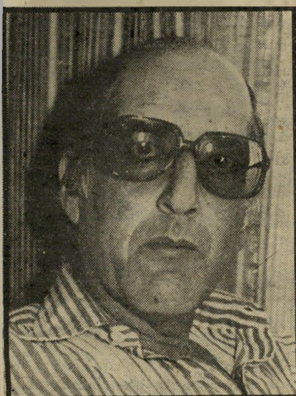
מנחה „כיפר“ ביגון „שרתון“ בשביל העובדות

את משרדי איתורית מאיישות בחורות צעירות. שהן המעבירות את כל ההודעות ללקוחות החברה. יבנה והבי, שחרחרת נאה בת 22, שהיא גם העובדת החתיקה ביותר בחברה אומרת: „ברור שיש לקוחות שולקחים את המכשיר ל-יצירת רושם בלבד. למשל מצלצל אדם,