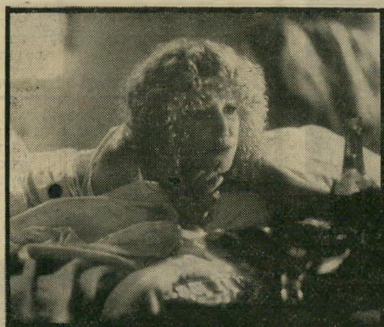
בט מידלר: אחת הבדרניות הגדולות

יש, אולי, צדק בדבריהם של אלה הטוענים כי הגברת מידלר, אחת הבדרניות הגדולות ביותר באמריקה, אינה