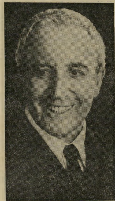
סלרס ב„להיות שם“ כמעט פרט בקאן

לעמדה של „השקעה בטוחה“, כלומר, להימנות על אותה עליית של שחקנים, ששמם בלבד דיו כדי לשכנע מפיץ שישר קיע כסף בסרטיהם. הוא גם לא זכה למעמד של שחקן-יוקרה, אולי משום ש נמלט מחשיפה עצמית על המסך, כאשר התארה בתוכנית החזרונות, הזמינו קר מיט להיות הוא עצמו. סלרס השיב: „זה בלתי אפשרי.“ הצפרדע תהיה מדוע והוא משיב: „כי אין דבר כזה, זה היה קיים