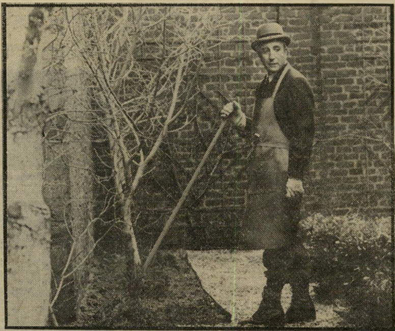
פטר סלרס בתפקיד הגנן ב„להיות שם“ כמעט מטורף

עדיין כוכב קולנוע פרובינציאלי, לפני שהוליווד גילתה אותו. העובדה שהדבר נאמר לא לפני תסייט, אלא מתוך אמונה כנה, מסבירה, במידה מסויימת, את הזדהותו עם התפקיד ואת העובדה שלהיות שם היה הצלחתו הגדולה הפעם שבה התקרבו יותר מכל אל האוסקר הנכסף, אלא שגם הפעם, כמו בפעמים קודמות, הפרס נגזל מידיו. פיטר סלרס, שנפטר לפני שבועיים