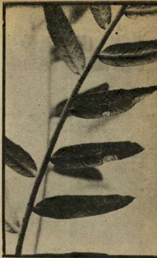
ענה פייפרון העלים העידו אחרת