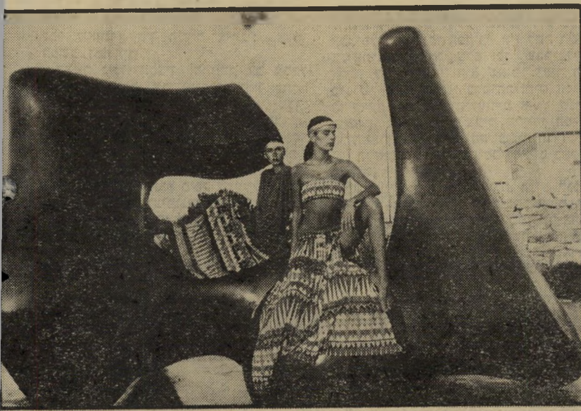
מלכות המים של.. העולם הזה