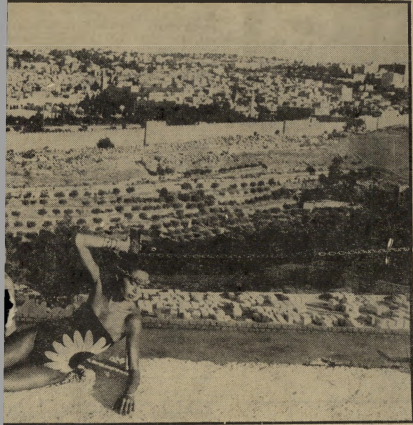
כיפת הסלע ורעמסס: חני פרי וח