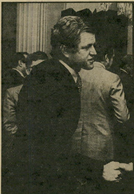
מועמד טד קנדי קואליציה עם רגן