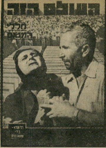
"העולם הזה" 930 תאריך: 11.8.1955