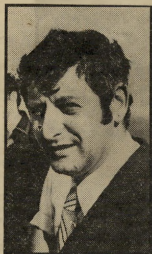
מהונאי כהן רק טיסות-שכר

אך משרד-התיירות הח-ליט שלא להמתין להחלטה לפתוח את שמי טבריה, וכבר הת-