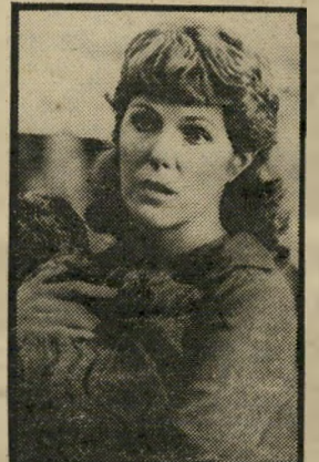
אביזן וגנב: דרגרייב יום ראשון, שעה 10.00

במיסגרת מורשה יוקרן הסרט שבת הארץ, המוקדש לשנת תש"ם שהיא שנת שמיטה. הי סרט מנסה לענות על השאלה: מה יהיו פני הדברים אם הי כנסת והממשלה יחליטו על קיום מיצות-שמיטה בימינו? כיצד יחולק היבול בין הצר-כנים? ומה עם השימוש בי-מחשבים בשנת שמיטה? אחרי הסרט ייערך דיון בהשתתפות