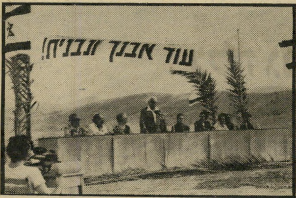
פרשת ליינדר ביום החמישי הבא (7.8)

יוקרן לראשונה בטלוויזיה הישראלית, הסרט מעוררי-המחזיקת "פרשת איילנד"