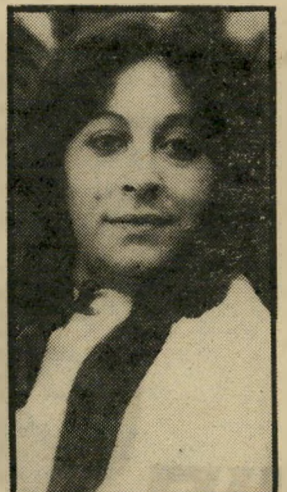
דרדרי שלום: בג'י יום שישי, 6.30

ג'ודי ודני שבים להתגורר בי-חדר בו התגוררו בילדותם. צ'אק ובובתו מתגרשים באחים. לדני יש כרטיס למישחק בייס-בול. מארי מבקשת שכולם יבן-או איתה לבילוי בקונוי-אילנד.