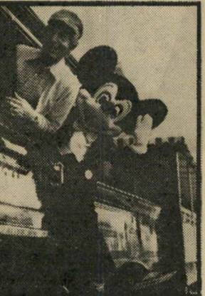
25 שנה לדיסני-לאנד: קיי יום שלישי, שעה 5.30

דרמה בריטית, אוי-דוט בני זוג המתגוררים באני-גליה והיוצאים לניו-יורק לבקר במקום הולדתו של הי-בעל. הווג מייצג את העולם המערבי המודרני, והוא זוכה