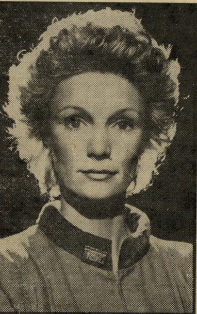
איבט מימיה כמדענית-חלל סוף דו משמעי

אנושי המיוחד במינו של רומא. כדאי לר- אות את הסרט. ומי יודע, אם ימצאו די אנשים שיילכו לצפות בו בסינמטק, אולי ישתכנע גם בעליו של בית-הקולנוע כלשהו להקרינו ברציפות.