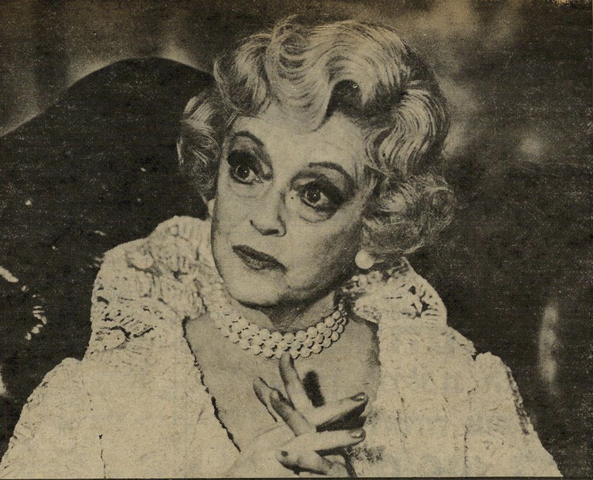
בט דיוויס בתפקיד הקפנית העשירה ב"כסף המר" סיפור-מוסר ממדרגה ראשונה

הסרט, שיוצג תחת השם הכסף המר, מספר על זוג עניים מרודים, הממתינים מדי שנה לזקנה עשירה כקורה ולנושא כליה, שיבואו לבקר בחווילה הרומאית המפוארת שלה. בכל פעם שהיא באה, היא מומינה את העניים לשחק עמה קלפים; היא מלווה להם את הכסף הדרוש לשם כך, ומוציאה אותו מידיהם באמצעות וכייה