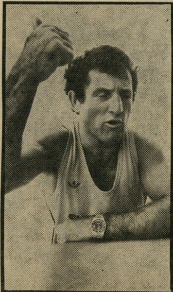
ג'ורדאובט מנינק רן ביוון

אני מסתכל בשידורי הטלוויזיה כדי לראות לאיזו רמה הגיעו המתעמלים. זה מעניין אותי מהבחינה המיקצועית. אני רואה מתעמלים שזוכים בניקוד גבוה על מכשיר הקפיצות, זה מכשיר שאני מגיע בו לאותה רמת ביצוע, אבל אני לא שם. יפה מצד הטלוויזיה שמסקרת בהרחבה את המישחקים. כולם רוצים לראות את רמת הביצוע וההישגים של כל הספורטאים, אבל ממעיטים בערכו של מי שלא נסע. לא מזכירים אף פעם את הספורטאים הישראליים שלא משתתפים בגלל הי