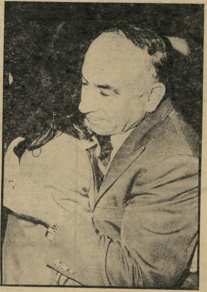
שרי-האוצר הורכביין גידול מחודש ללא אינפלציה, שי יהיה בו כדי להחזיק לאורך ימים

תעסוקה, השקעות וייצוא? במיטת גרת-הלך-המחשבה של האוצר אין תשובה לשאלה הזאת. לגביו זהו עניין שבאמונה. הוא מפתח שחידוש הפיתוח יגביר את האינפלציה, האם נובע מזה שנצטרך לחיות, מעתה ועד עולם, עם אבי