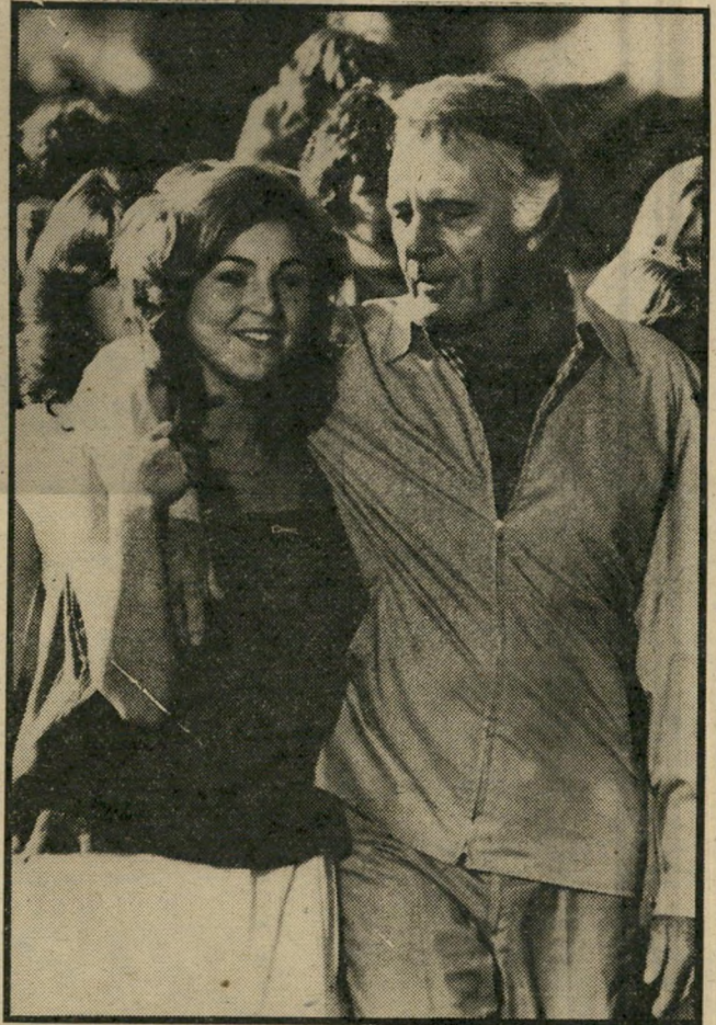
אהבה סתווית: עם טאטום או'ניל, ב"מעגל לשניים"