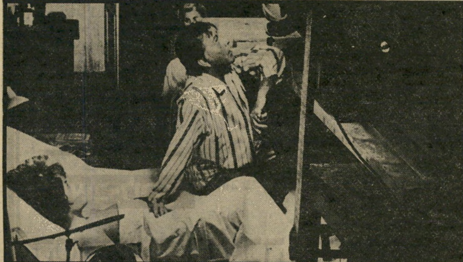
המיטה הציבורית: מעמד מתוך סרטם המשותף של ברטון-טיילור, "השחקנים"