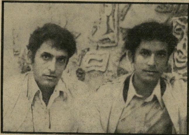
תאומים חקק נקם וליניץ

תגובת הציבור הירשאלני למעשה החטיפה מעוררת כמה סימני שאלה. נכון שהרגשת השכול היתה משותפת לכולנו וכי מצאנו עצמנו מלאי הערכה למישפחת ירדן האצילה והאמיצה. אבל היו בינינו גם גילויים של קריאות נקם וליניץ, שהופנו לעבר החוטף, ור למרבה התמיהה גם כלפי מישפחתו האומללה וכלפי מישפחת חברתו. האיש האחד חטא — אך אל נטיל את הקצף על כל העדה (אם להשתמש בלשון המקראית). רק החוטף צריך להיות מוקע ור נענש. האוכל בוסר תקהינה שנוי.