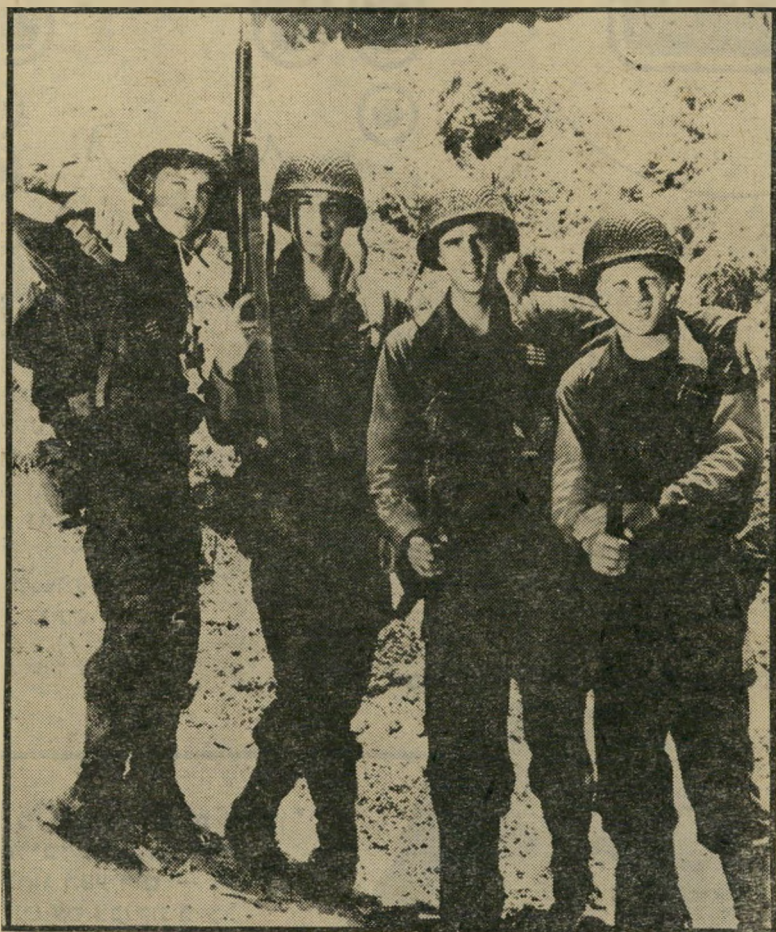
מארק האמיה, רוברט קאראדין, בובי דה-צ'יקו וקני זורד במילחמות אין גיבורים — ישנם שרידים

להיות ביטוי לאנדרלמוסיה האוחזת בעולם האמנות, כאשר השיוויון צריך לתפוס את מקום הכישרון; זאת יכולה להיות נבואה של איטליה, שבה הכוח היחיד המאחד את כל הפלגים הרבים של הנוף הפוליטי, הוא ההתנגדות למי שעומד בראש המדינה: זאת יכולה להיות תמונה של עולם היודע רק למה הוא מתנגד, אבל אין לו מושג במה הוא דוגל; זאת יכולה להיות תמונת מצב של דור-האני, דור הפולחן העצמי של הפרט, המסרב להוות חלק מן הכלל. וזה יכול להיות אפילו משל ההולס את המציאות הישראלית: במילחמות הרבות שבין הסוציאליסטים ואנשי הקידמה למיניהם, מנצח, בסופו של דבר, קולו הרועם והצרחני של הפאשיסטים.