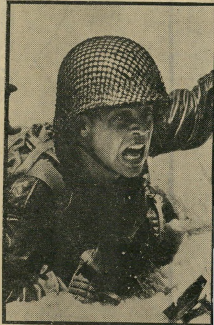
קאראדין מסתער הבמאי היה לוחם

תהילת הרגע. כאשר הגיע המוצר המוגמר לפסטיבל קאן, ועמו הבמאי, הי מפיק והשחקנים, היה זה כבר לאחר קרב, כאשר רוחות שימחה ועליצות כבר החלו לנשב. מי שלא ראה את פולר בריוויירה, לא ראה שימחה מימיו. בבוקר שבו הוצג סרטו, כמייצג ארצות-הברית בתחרות הי רשמית, צילצל הטלפון מלוס-אנג'לס. "הסוכן האישי שלי התעקש לקרוא באוזן ני את כל הביקורת הגלגלת שהופיעה באותו היום, בביטאון המיקצועי וראייטי. ידעתי שהוא עבר ניתוח סרטן בגרון לפני כמה שבועות, ופחדתי שעוד יקפח את חייו בגלל סרטי". מתלוצץ פולר.