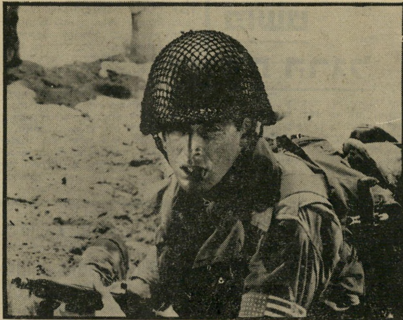
רוברט (בובי) קאראדין בתפקיד זב, דמותו של פולר בנעוריו