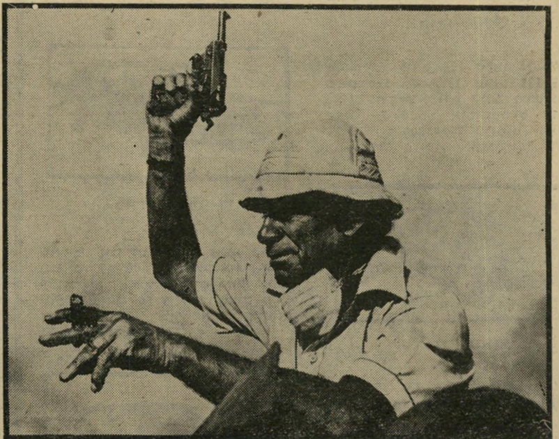
סמואל פולר מביים את „הגדולה האדומה“ הטיגר נשאר ממלחמת העולם השנייה

זה סיגנון מקביל לספרות-המתח האמרי-קאית, שהצמיחה מתוכה מחברים כמו דישיאל האמט וריימונד צ'אנדלר, שי-כתביהם הראשונים התפרסמו בחוברות-בילוש מן הסוג העלוב ביותר.