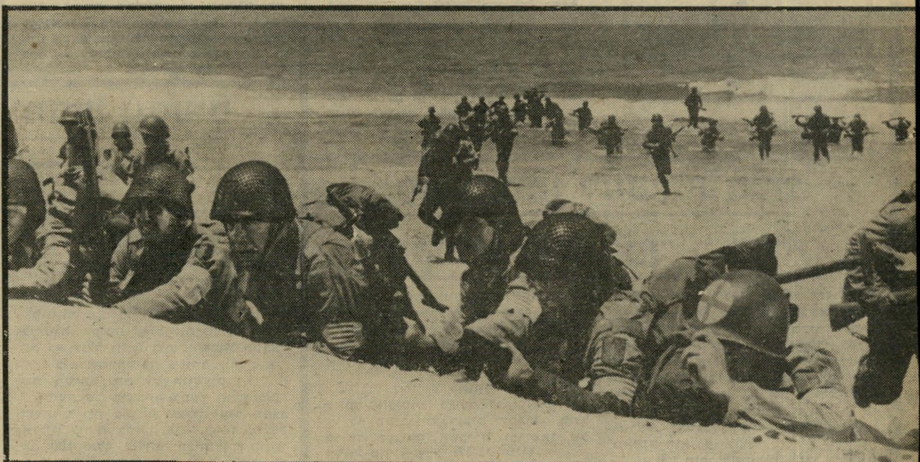
חיילי החטיבה ה„גדולה האדומה“ מסתערים על חוף אומחה חופי נתניה מחליפים את חופי אירופה

מלחמת העריכה. לכן נדמה היה שחלומו — סרט על החטיבה שבה לחם, מנקודת מבטו האישית, כחייל-רגלי ולא כגנרל מכופתר — לא יתממש לעולם. עד שנתקל בפייטר בוגדאנוביץ' שהמריץ או-תו לכתוב את הסיפור. „אם לא יהיה סרט, יהיה ספר“, טען. ואכן, גם הספר עומד לצאת לאור. אחר כך נתקל בג'ין קורמן, מפקי זריו שהשחין כישרונותיו באסכולה היעילה ביותר של הוליווד, סר-טי אחיו המפורסם, רוג'ר, ג'ין הביא את פולר לישראל, הראה לו כיצד אפשר לצמצם באורח משמעותי הוצאות של סרט, ולרכוז את כל העבודה בישראל תחת לצלמו בכל אירופה. לכן הפך הי-