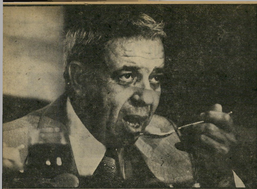
יושב-ראש שביט לאכול את כולם ובבת-אחת

פט בישראל. הצעיר הקרה והי-משופם התפרסם בעקבות מעשי מירמה ונזילות אותן ביצע באר-צות-הברית ואתן הוא ניסה לבצע בארץ.