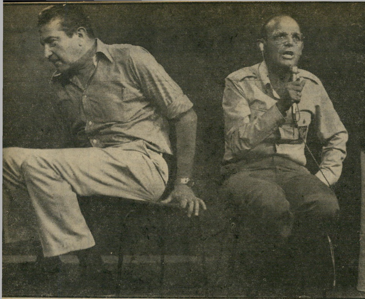
שדר רם ושר לשעבר וייצמן מי רודף ומי בורח?

קשה לאמר שאין שר שלא מדליף. מדי פעם אפשר למצוא, בתקופה מסוימת או בעניין מסוים, שר שאינו מוטרד מידע מתוך ישיבות, סודיות או שאינן סודיות.