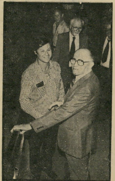
שדר יבין וראש-ממשלה בגין הדלפות בדרג-עליון

דיות. אולם בדרך כלל, לכל שר יש את העיתונאים-הידידים שלו, להם הוא מדי-ליף באופן פחות או יותר קבוע. לעזר-מת זאת קשה למצוא שר שלא נאם אף פעם נאום נגד המדליפים.