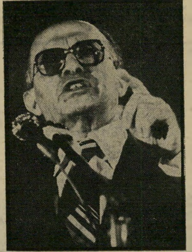
מנחם בגין שולט בזכות כשרונותיו האמנותיים

טים, אמנם בשקט. הם יוכלו לשחק וכאילו לבטל את עצמם, אך כל חב-ריהם ינסו להשביע את רצונם, ומדי פעם ישלחו מבט לעבר האריה, לראות האם הוא מרוצה, או אולי אפשר לשרת אותו במשהו. הצורך לשלוט הוא כה חזק, עד שגם מיקצועותיהם קשורים על-פירוב בשלטון. כושר האירגון והני-