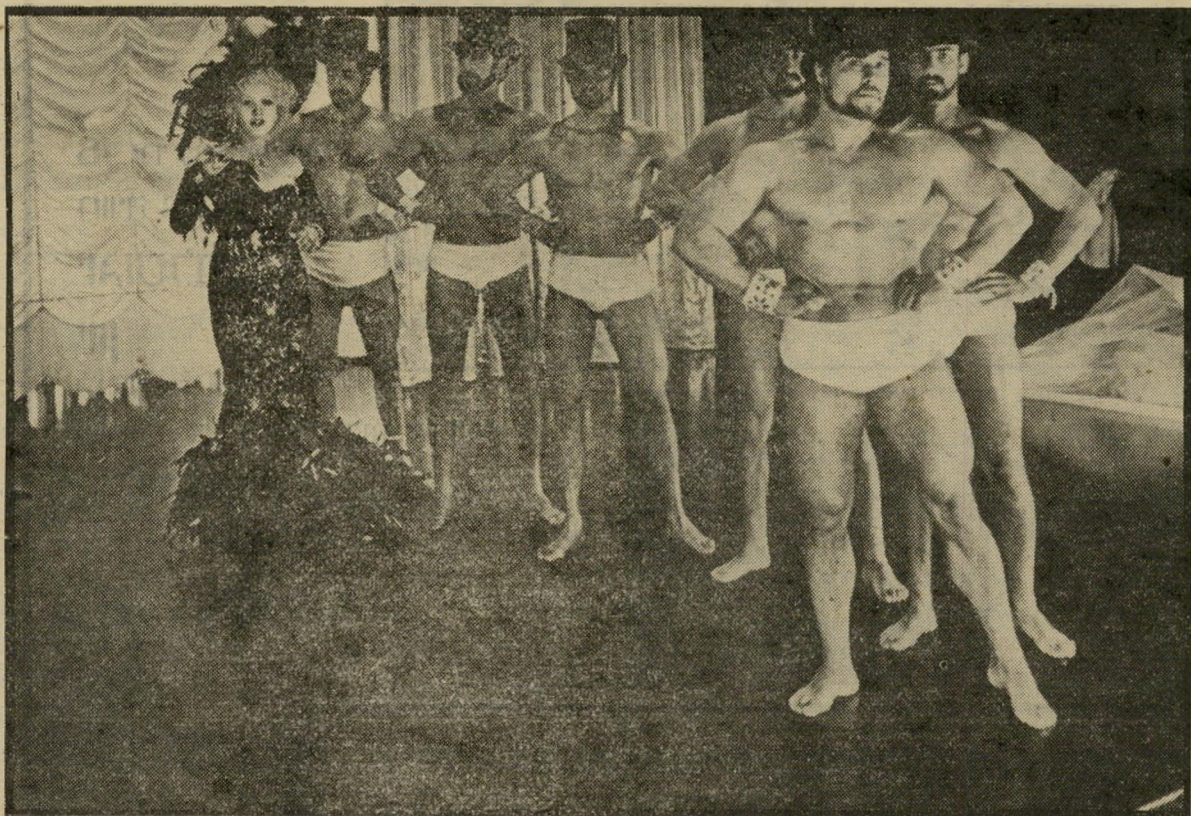
תחרות יופי לזכרים, אחד המעמדים בעיר הפמיניסטיות הביטויים החריפים, הקיצוניים והאבסורדיים

מרד נגד המנצח, אנרכיה מוחלטת והי אולם המתמוטט על יושביו מזכירים משום מה את פני איטליה היום, ואולי גם את פניהן של כמה ארצות מתועשות אחרות במערב. מי שתקף את פליני על עמדתו נגד האיגודים-המיקצועיים ועל הרמז שהתי ארגנות הפועלים לפי המודל השגור בימינו יכולה להוליד רק אנדרלמוסיה ודיקטטורה, צריך היה להסכים שבמאי זה הציג את המשל שלו בצורה משכנעת, ועובדה היא.