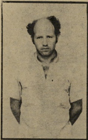
נאשם גור עזרה לשוטרים

השניים התגייסו יחדיו לצבא ושירתו ביחידות סמוכות עד ש'