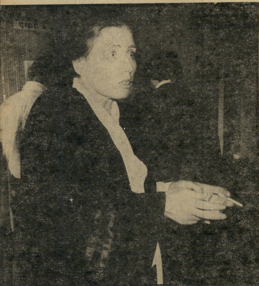
תופעת מירוטה חטיפה מחשורת חוקית

אם לא יצליחו רופאי ההגנה להוכיח, שגור סובל ממחלת־נפש מוכרת, לא תהיה אפשרות לנסות את ההגנה הנוספת, של דחף־שאינו־ברי־כיבוש. גם דחף כזה מהווה הגנה מישפטית רק אם הוא מברר סע על מחלת־נפש מוכרת וידועה.