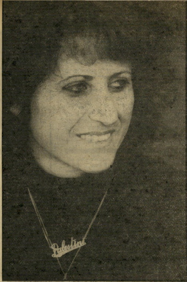
עיתונאית אר-טאוול ותתיון PALESTINE

החלטה בית-המישפט הגבוה לצדק להכריח את שר-הפנים להניז את שעון-הקיצ היתה בעלת ערך ממשי וסימלי כאחד. היא סימלה את נכונות בית-המישפט לצעוד עם הזמן — וגם את נכור נותו למלא, מאונס, את החלל הר ריק שנוצר בעיקבות אי-התפקוד של הממשלה.