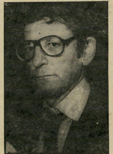
עמוס אילון יצירת ספרות מהממת