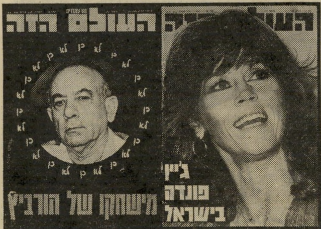
השער הקידמי (משמאל) והשער האחורי של "העולם הזה" (2234) כל אחד במקום היאה לו

ד.ב.ר. חיים, ירושלים ● את התשובה על השאלה ימצא הקורא ברחיים במאמרו של