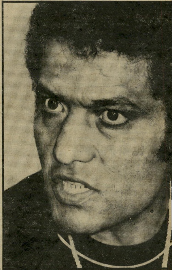
מזוכה-מרצח עיסא בעיטות באשכים

אשר השפיעו על תוצאות מכונת-האמת. היא גילתה את האמת הדמייונית של סעיד, ולא את האמת האובייקטיבית. גם ההודאה שמסר נבעה מאותם מקורות נפי שיים.