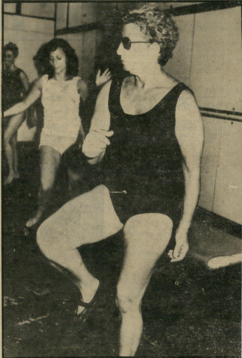
מתעמדת בעת השידור היעד: 160 פעימות בדקה

המחול הופך אירובי, אם הוא אינטנסיבי דיו להביא לשאיפת כמויות מוגברות של חמצן לאורך זמן, להבדיל מפעילות אנאירובית, שהיא כל תנועה התחלתית, כמו