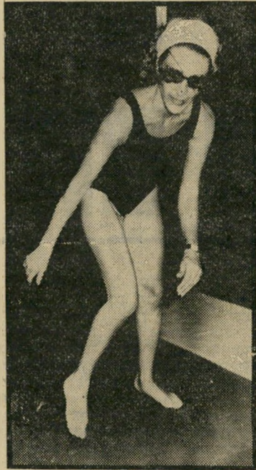
מתעמדת שנשברה קצת מישמעת עצמית

"בלי הזכות להיות נוכחים במישפט כזה, הקיימת מזה דורות, יתרוקנו מתוכנם מרכיבים חשובים של חופש-הביטוי ויחופש-העיתונות," קבע בית-המישפט. מור-תר לחרוג מכך רק כאשר קיים אינטרס ציבורי "מכריע" — ובמקרה זה חייב השופט לציין בכתב מהו האינטרס הזה.